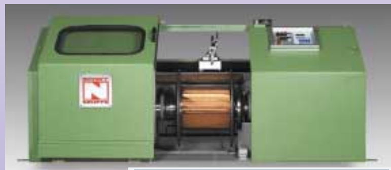
Einzelspuler in Gegenhalter-Ausführung Single spooler in outboard bearing design

In the case of barrel coilers with model designation „WF“ the wire arriving from the drawing machines passes through a traversing device and falls into a barrel below. The movement of the traversing device means that the wire turns are placed at a slight offset to each other from turn to turn. As the result of this „rosette“ laying method, the drum is filled evenly and individual turns cannot become tangled with each other. The investment and operating costs of a barrel coiler are relatively low. Barrel coilers are suitable for the