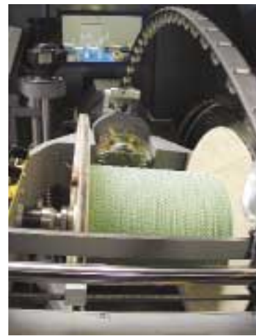
Die DSI-Maschinen ermöglichen die Paar- und Hauptverseilung The DSI machines enable pair and main stranding operations

und Hauptverseilung möglich ist, lassen sie sich flexibel einsetzen und optimal zu neuen Verfahrenstechniken kombinieren. Vergleicht man die Kombinationsmöglichkeiten der DSI-Maschinen, um ein bestimmtes Produkt zu fertigen oder eine bestimmte Fertigungsleistung zu erbringen, mit dem Einsatz anderer Maschinen und Verfahrenstechnologien, so ergeben sich für den Einsatz der DSI-Maschinen große finanzielle Vorteile bei den Investitions- und Betriebskosten. Je nachdem, welche Parameter bei einer Vergleichsrechnung zugrunde gelegt werden, erbringt der Einsatz von DSI-Maschinen beim Verseilen von Datenleitungen Kostenersparnisse von 30, 40 oder gar bis zu 50%. Von der ersten DSI-Serie wurden bereits einige Maschinen verkauft. Zur Vervollständigung des Programms werden derzeit Anlagenteile zugekauft, so ein antriebsbarer Längsbandabwickler, der während des Verseilens eine Abschirmung aufbringt. Etliche Komponenten werden künftig mit viel Know-how von NIEHOFF selbst hergestellt. Das DSI-Maschinen-Programm wird ständig erweitert, ein größeres Modell ist in Planung.