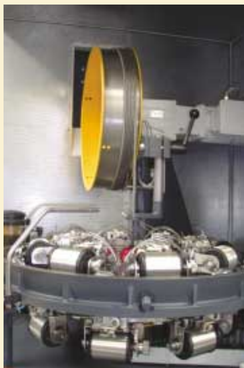
Arbeitsraum der BMV 16 Working compartment of the BMV 16

Nach Durchlauf eines intensiven Testprogrammes werden die