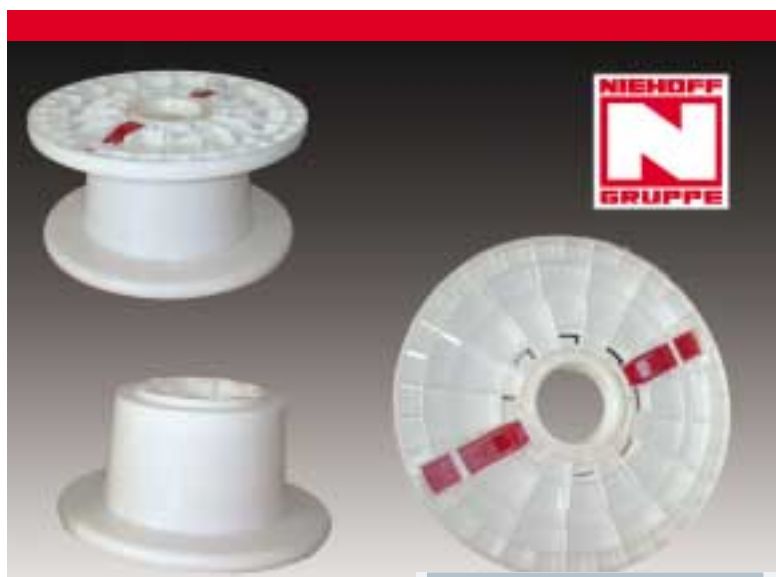
Die zerlegbaren NPS-Spulen helfen Kosten zu sparen The knock-down NPS spools help to save costs

A PE steam curing device, model VDV 400, was recently developed for the NPS, which can be installed in any existing NPS line and offers a whole series of advantages over conventional silane curing. The curing process takes place in the wound material and therefore requires special spools that have openings to allow the steam to pass through. This spool model, a