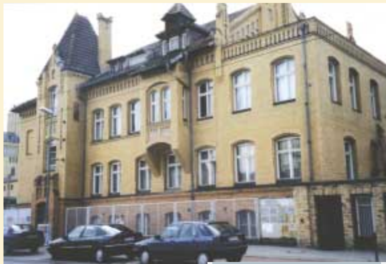
Das neue NIEHOFF-Vertriebsbüro in Berlin The new sales office in Berlin

Die ersten Hochgeschwindigkeits-Flechtmaschinen „made by NIEHOFF“ wurden im Juli 2002 auf einer dreitägigen Hausausstellung im NIEHOFF-Stammhaus Kunden aus der Kabelindustrie vorgeführt. Die für 16 oder 24 Flechtspulen ausgelegten Modelle BMV 16 und BMV 24 können Draht aus blankem oder verzinnem Kupfer, Aluminium oder nichtrostendem Stahl mit 0,05 bis 0,3 mm Durchmesser sowie Fäden aus Kunststoffen oder Textilien verarbeiten. Zu den technischen Besonderheiten gehören eine stufenlose Regelung der Geschwindigkeit und der Flechtsteigung, eine bedarfsgerecht optimierte automatische Zentralschmierung und ein integrierter Auf- und Abwickler für Spulen mit bis zu 800 mm Flansch-