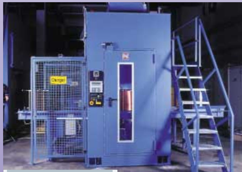
Vertikaler Statikwickler Vertical static coiler

To draw high-quality wire a whole range of factors have to be taken into consideration. In previous editions of NIEHOFF-News, we covered wire pay-off, rod drawing, drawing die sequence, drawing capstans, drawing agents and drawing dies as well as heat treatment factors. This issue now looks at coiling and spooling. Coiling and spooling are procedures without which it would be impractical to manufacture wire and cable. A range of systems with different functions is available to coil the material either into spool-less bundles or on to spools. When selecting the system and the type of bundle it is important to ensure that the material is not damaged during transport and can later be unwound properly and at the required speed. NIEHOFF offers three systems that are tailored to differing requirements.