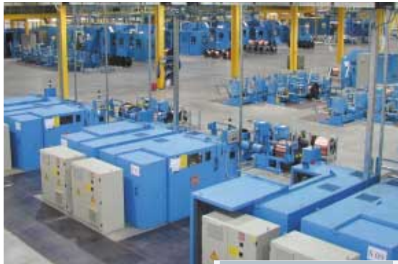
Von NIEHOFF konzipierte Draht- und Kabelfabrik Wire and cable factory designed by NIEHOFF

tionsplanung umfasst die Ermittlung der Lagerflächen, der Lagertechnik und der optimalen Materialbewegungen. Außerdem wird der Personalbedarf errechnet. Im Zusammenhang mit dem Fabrik-Layout stehen die Ermittlung des Flächenbedarfs und der Infrastrukturen sowie die Versorgung mit Betriebsstoffen. NIEHOFF konzipiert die erforderlichen Einrichtungen, beispielsweise zur Brauchwasserkühlung, Wasseraufbereitung, Luftumwälzung, Abluftbehandlung sowie Versorgungsleitungen und die Filteranlage für die Ziehempulsion. Als Maschinen-