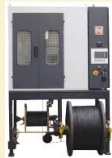
Flechtmaschine Typ BMV 16 BMV 16 type braider

An extensive series of tests is underway which should see the BMV braiders ready to go into industrial use at the end of the 4th quarter of 2002. Because of the experience of NIEHOFF's braiding machines specialists and through the machines' long-term tests, buyers of the new machines can be sure that already the very first delivered machines are practice-proven and reliable workers. In the year 2003, the worldwide distribution of these machines will start.