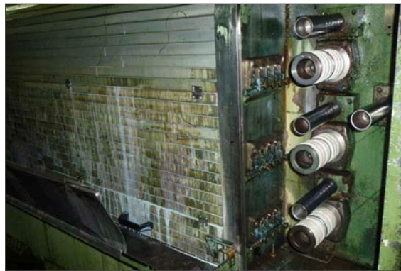
Mehrdrahtziehmaschine Typ MMH vor der Überholung durch NIEHOFF

In vielen Fällen kommt die Modernisierung einer Maschine in Betracht, wenn die Antriebstechnik defekt ist und bestimmte Komponenten, beispielsweise Drehstromsteller oder Umrichter, nicht mehr lieferbar sind. In diesen Fällen bietet es sich auch an, eine Maschine mit neuen AC-Motoren auszustatten, die energieeffizienter arbeiten als die früheren DC-Motoren und wartungsfrei sind.