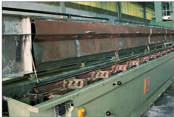
Walzdrahtziehmaschine Typ M 85 vor der Überholung durch NIEHOFF

Die erste Maßnahme bei einem Modernisierungsprojekt besteht darin, dass NIEHOFF-Techniker die fragliche Maschine oder Anlage beim Betreiber inspizieren und ein Angebot erstellen. Die Überholung von Walzdrahtziehanlagen und kleineren Einzelmaschinen wie Spulern und Verlitzmaschinen erfolgt in der Regel vor Ort beim Betreiber. Mehrdrahtziehanlagen können ebenfalls problemlos beim Kunden überholt werden oder werden in den geräumigen Werkstatthallen im NIEHOFF-Stammhaus oder bei einer Tochtergesellschaft mit eigener Fertigung modernisiert.