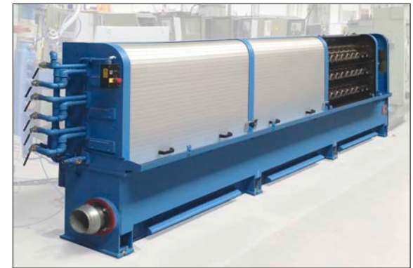
Beispiel für eine überholte Mehrdrahtziehmaschine Typ MMH

Weitere Maßnahmen sind die Steuerung zu modernisieren, neue Bedientableaus mit intuitiver Bedienung zu installieren und die Steuerungssoftware zu aktualisieren. Manchmal empfiehlt es sich auch, den Schaltschrank zu modifizieren und beispielsweise mit einem stärkeren Kühlsystem auszustatten. Für die Betreiber von NIEHOFF-Systemen ist es dabei vorteilhaft, dass NIEHOFF elektronische Steuerungen aller Art im eigenen Haus entwickelt, inklusive der dazugehörigen Software. Diese Steuerungen sind optimal auf die individuellen Anwendungen abgestimmt und helfen, Fertigungsprozesse zu optimieren und dabei Kosten zu reduzieren. Ein Beispiel in diesem Zusammenhang ist der Glühregler NAC (NIEHOFF Annealing Controller) für elektrische Widerstands-Durchlaufglühen.