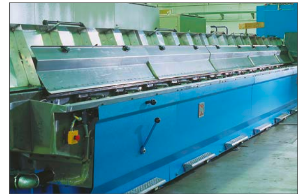
Beispiel für eine Walzdrahtziehmaschine Typ M 85 nach der Überholung

Derart umfassend modernisierte Maschinen sind nicht nur „wie neu“, sondern haben oft eine höhere Leistungsfähigkeit als zuvor. Es lohnt sich also, NIEHOFF-Maschinen auch nach jahrzehntelangem Einsatz einer Generalüberholung zu unterziehen, um sie wieder in Top-Form zu bringen.